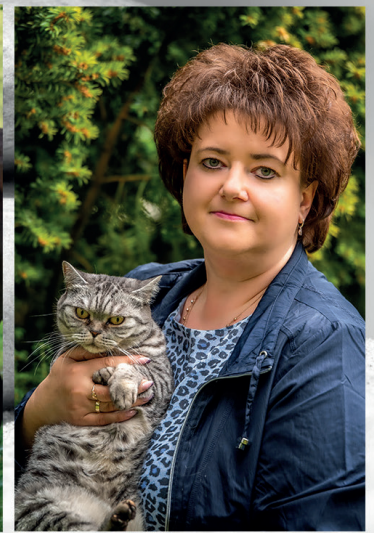
Tatjana Bekker Bestattungen und Beratung

Volker Hoof · Bestattungen · Trauerreden