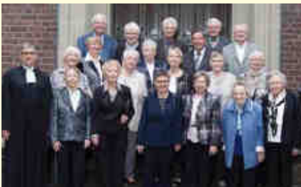
Eiserne Konfirmation Bezirk 3