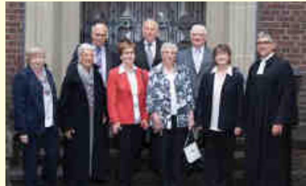
Diamantene Konfirmation Bezirk 2