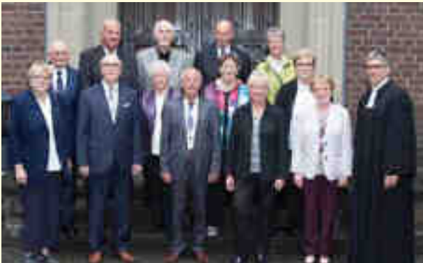
Diamantene Konfirmation Bezirk 1