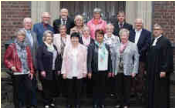
Diamantene Konfirmation Bezirk 3