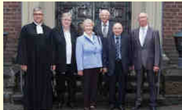
Eiserne Konfirmation Bezirk 2