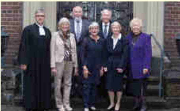
Eiserne Konfirmation Bezirk 1