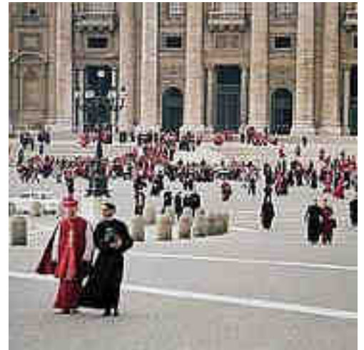
So begegneten sich die Väter des 2. Vatikanischen Konzils, 1962-1965