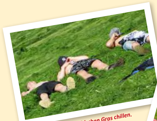
... und unsere Jungs im frischen Gras chillen.