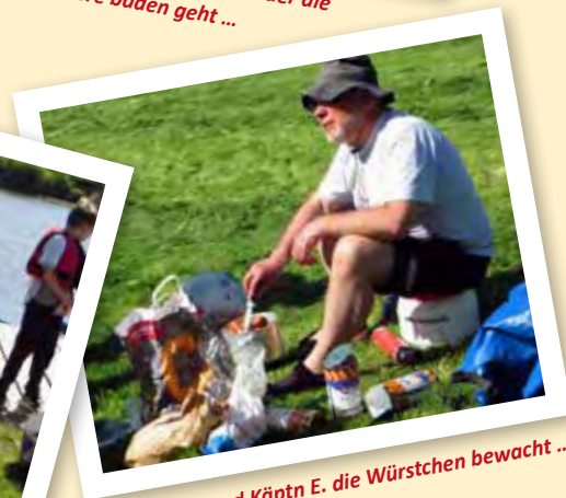
... und während Käptn E. die Würstchen bewacht ...