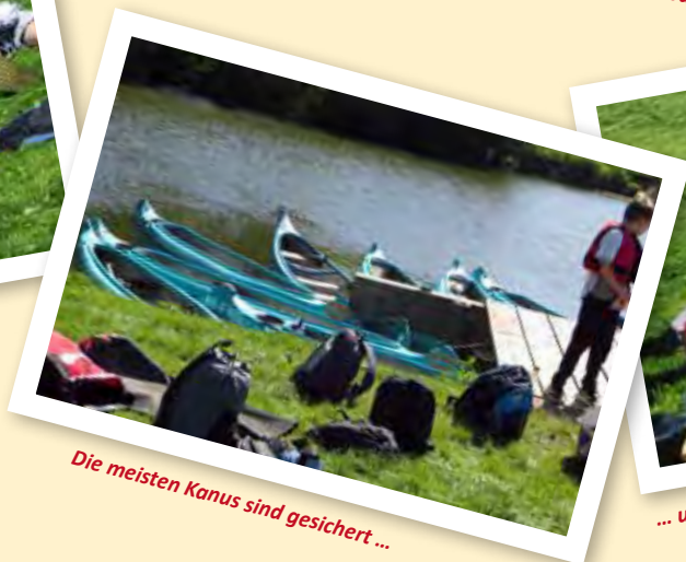
Die meisten Kanus sind gesichert ...