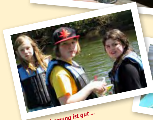
... die Stimmung ist gut ...