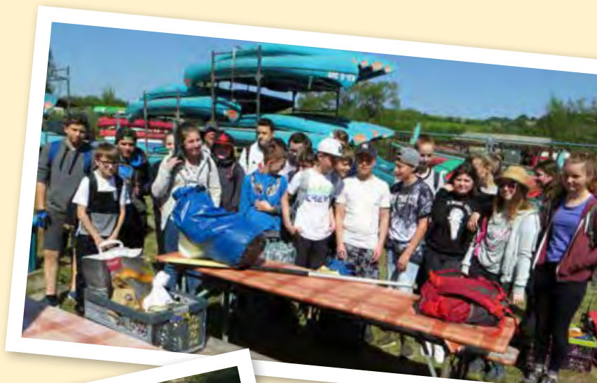
Kurz vor der Tour beim Kanuverleih ...