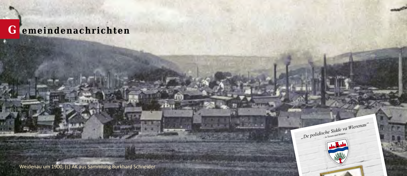
Weidenau um 1900